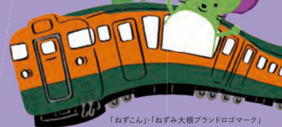
「ねずこん」・「ねずみ大根ブランドロゴマーク」 坂城町長承認No.31坂商第4-4号