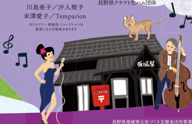
長野県地域発元気づくり支援金活用事業

2026 5.31 sun 10:30-16:30 (ラストオーダー 16:00)